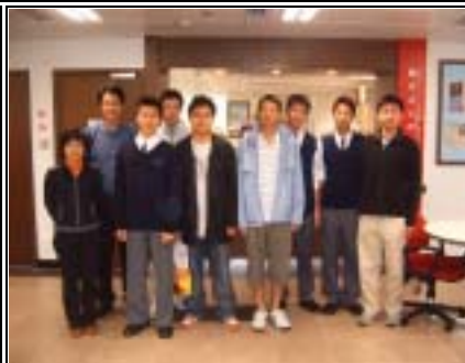
勞工處職員和本校師生合照