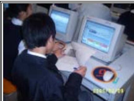
同學正填寫性向測試問卷

為讓中一同學了解自己的興趣及相關職業資料，本組舉行了中一級「職業檔案」活動，活動中同學首先完成性向測試問卷，再依從問卷結果於勞工處網頁中尋找相關之職業資料。