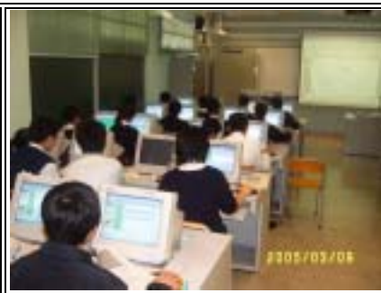
同學於勞工處網頁中尋找 相關之職業資料