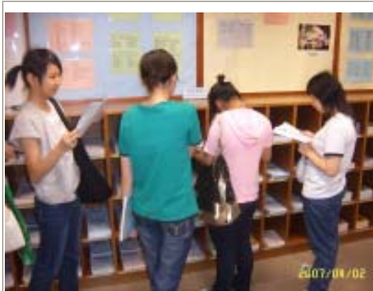
同學於職業資料中心內找尋有關職業的資料