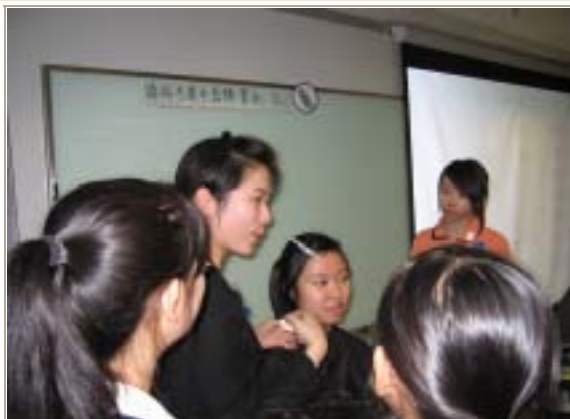
同學參加簡單美容課程