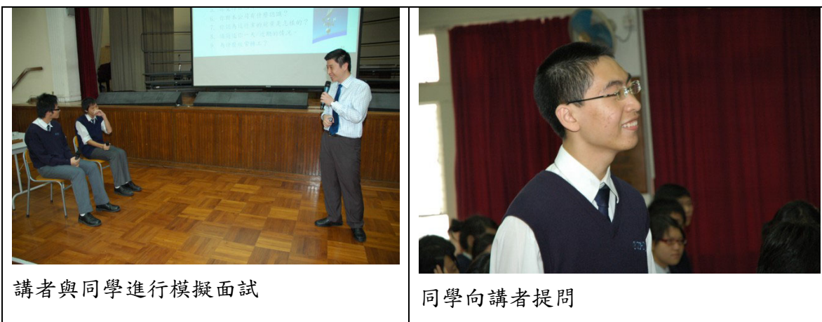
講者與同學進行模擬面試