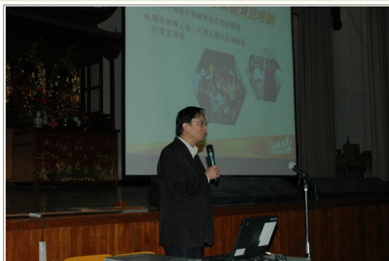
職業訓練局職員向同學介紹職業訓練局課程及申請方法。