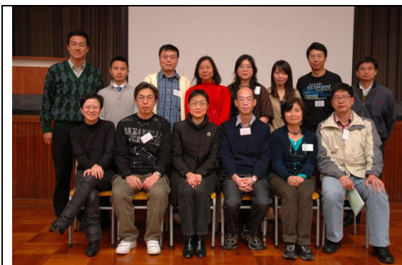
校長與導師們合照