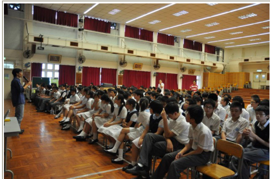
講者向同學講述如何建立積極人生態度