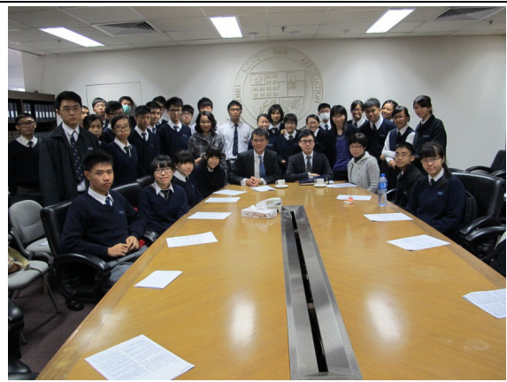
參觀結束後大伙兒合照