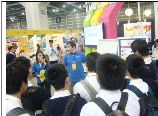
職員向同學講解英文課程的資訊

升學及就業輔導組於2013年2月1日安排全級中五同學參觀「教育及職業博覽2013」，讓同學對香港中學文憑考試後之升學及就業出路有更多了解。