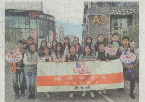
▲遊學團為同學帶來了寶貴的經驗

下午又一個高潮出現了，故宮博物院裏的宮殿、王椅、聖旨、奇珍異寶已不在是書本上的內容了，當他們活靈活現地顯現在學子們面前時，同學們像海綿一樣吸