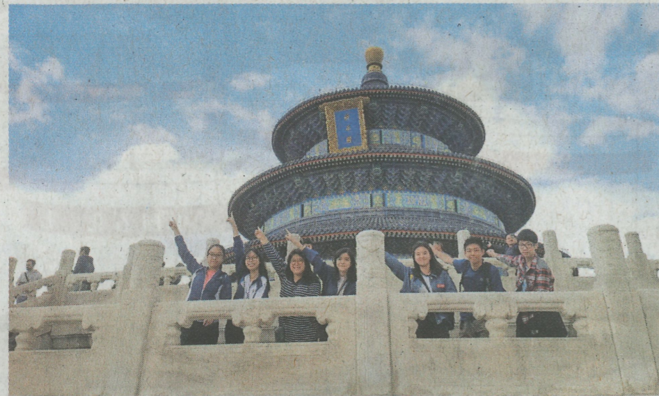
▲同學們於天壇公園遊覽，感受皇家祭天的建築與宏偉

「旅遊知識王」是一個以旅遊文化知識為主題，以真人秀比賽為活動形式，以電視節目為表現形式，以電視、網絡為傳播載體的文化知識綜藝節目；其主要對象為港澳中小學生，以寓教於樂，寓教於遊的模式，開展國情教育的創新模式，它不僅增加港澳青少年及同胞對祖國的親情與認同，更進一步促進港澳同胞到內地旅遊的熱度。「旅遊知識王」自舉辦以來，已取得豐碩成果，得到了國家文化和旅遊部亞洲旅遊交流中心的肯定，並在其鼓勵與支持下積極深入探索、發展。