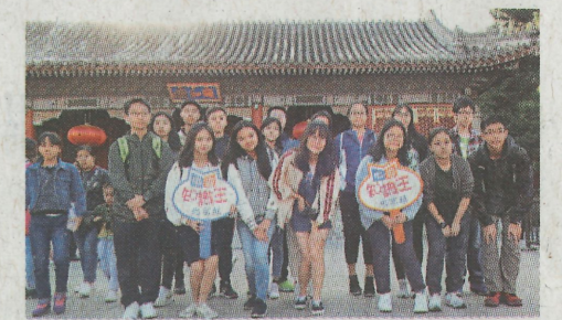
▲同學們參觀頤和園，見識皇家庭園壯麗