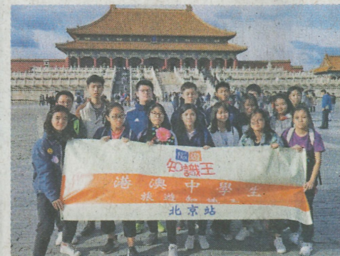
▲參觀故宮博物院裏的宮殿，了解昔日皇朝歷史

由北京市旅遊發展委員會主辦，亞太旅遊聯合電視台製作，並由亞洲旅遊交流中心支持的「旅遊知識王」北京站，日前已於北京順利舉行。一行27人組成的港澳師生遊學團，乘坐由香港至北京的高鐵，遠赴首都北京參加為期四日的「旅遊知識王」北京站遊學團。