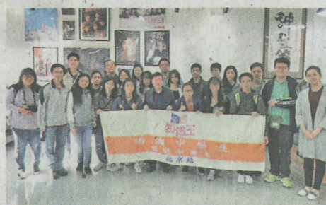
▲拜訪香港著名製作人文雋工作室

今年「旅遊知識王」移師到國家首都北京舉行，9月初，主辦單位向港澳地區中學開展校園宣傳和海選活動，並為港澳參賽學校隊伍進行拍攝及初賽甄選，是次活動參賽學校十分擁擠，共有八間中學競逐初賽，包括：香港培僑中學、惠僑英文中