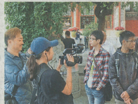
▲同學們來到老北京的南鑼鼓巷，看到橫成古巷豎成胡同的北京舊城風貌

第二天，遊學團學子們沿着美麗的延慶山路畫廊，登上了夢寐以求的八達嶺長城，除了欣賞雄偉壯觀的景觀外，他們還吟起了自己創作的詩句，表達愛國之情。9月北京的天氣真的很調皮，剛剛還晴空萬里，瞬間就瓢潑大雨，雨後同學們來到老北京的南鑼鼓巷，看到橫成古巷豎成胡同的北京舊城風貌，品嚐特色小吃，同學們