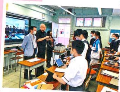
● 兩校作英語視像教學活動