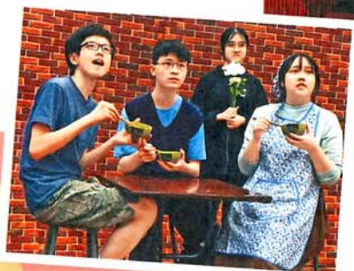
● 劇社同學於「香港學校戲劇節」演出精彩