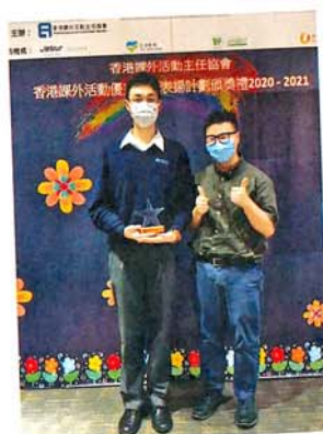
● 同學獲頒「香港課外活動優秀學生」獎座