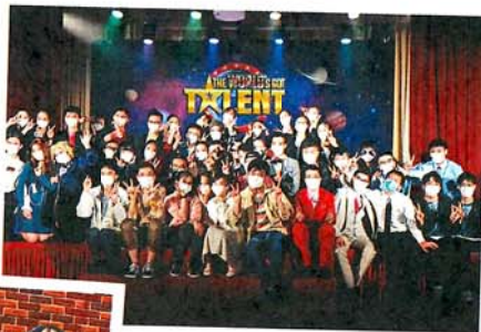
● 英語音樂劇《The World's Got Talent》表演盛況