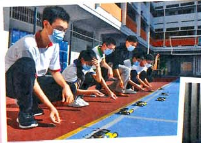
● 太陽能電動車工作坊

本校致力培育品學兼優的好學生，以「明智顯悲」為校訓，透過佛化教育幫助學生建立正確的價值觀和長養健康的心靈，在瞬息萬變的世界裏安身立命，達到境隨心轉的自在境界。學校近年更開設禪修課，推廣禪修的好處，透過坐禪、行禪、細味禪、抄經禪等方式鼓勵學生將禪修融入日常生活中，幫助自己舒緩壓力和情緒。除了著重學生身心靈成長外，學校亦重視學生的學習效能。近年，電子教學乃大勢所趨，全校課室已增設互動觸控顯示屏，配合中一、二級的自攜裝置(BYOD)計劃，教師收集學生自主學習課業後，從中分析學生學習難點，適時調適教學，使學生掌握分析、思考及討論等學習技巧，提升學習效能。上課時，教師透過電子平台如平板電腦提問，學生可即時回應，增加學生課堂參與度，並善用學生回應作出教學回饋，提升學與教水平。本校同時重視STEM的發展，透過舉辦不同的工作坊，例如鑑證科學班、『CoSpaces』創意遊戲創作、『Hologram』立體投影製作、太陽能電動車工作坊等，鼓勵學生投入參與，發揮創意，享受學習。