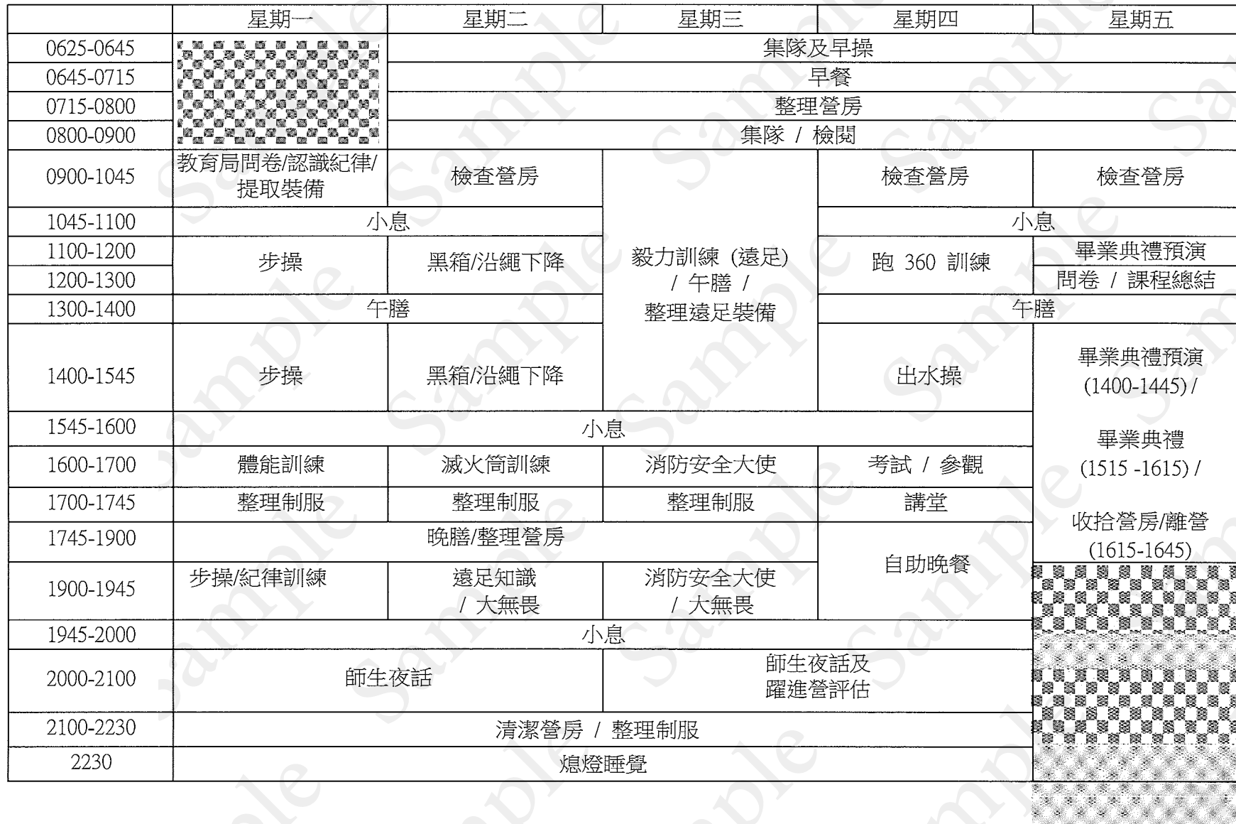
香港消防處 消防及救護學院「多元智能躍進計劃」多元智能挑戰營時間表